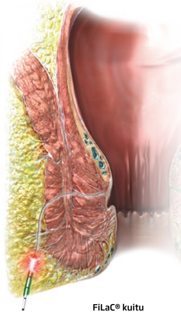
FiLaC® kuitu laserhoito

Laserhoito kestää vain muutaman minuutin, ja sen avulla voidaan täysin säästää fistelikanavaa ympäröivä terve kudos.